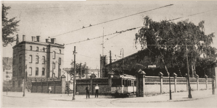
Gesamtansicht des Straßenbahnbetriebshofes Halensee