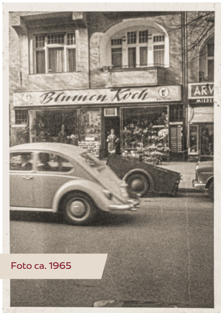
Foto ca. 1965