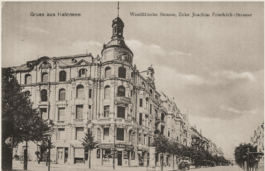
Gruss aus Halensee